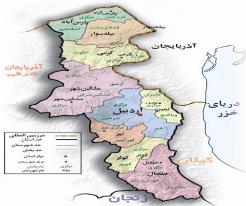
شکل ۱- نقشه موقعیت سیاسی استان اردبیل

استان اردبیل در شمال غرب ایران قرار گرفته است. مساحت این استان ۱۷۸۱۳,۲۳ کیلومترمربع می باشد. این استان از شمال با جمهوری آذربایجان، از شرق با استان گیلان، از جنوب با استان زنجان و از غرب به استان آذربایجان شرقی محدود شده است. حدود دو سوم استان اردبیل دارای بافت کوهستانی با اختلاف ارتفاع زیاد و بقیه را مناطق هموار و پست تشکیل می دهد. استان اردبیل طبق آخرین تقسیمات کشوری از ۱۰ شهرستان، ۲۹ بخش، ۷۱ دهستان، ۲۶ شهر و ۱۸۵۲ آبادی تشکیل یافته است (سایت مرکز آمار ایران). طبق آخرین سرشماری عمومی کشاورزی سال ۱۳۹۳ دارای ۶۷۰۸۷۱ هکتار اراضی زراعی و ۸۶۶۵۵ بهره بردار می باشد. که از این مقدار ۹۹۸۷۸ هکتار به صورت آبی، ۳۵۶۳۰۷ هکتار به صورت دیم و ۲۱۴۶۸۶ هکتار بصورت آبی ودیم توأم، زراعت می گردد (سایت مرکز آمار ایران).