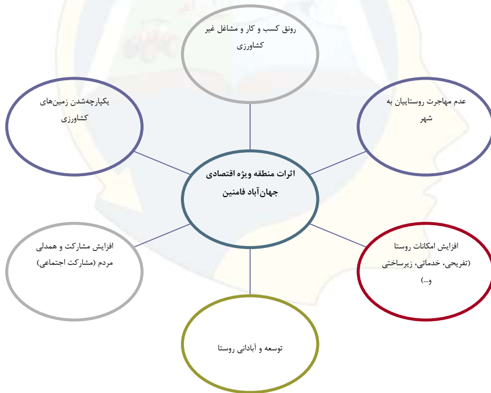
آباد از دیدگاه مردم بومی منطقه نمودار (۱) اثرات منطقه ویژه اقتصادی روستای جهان